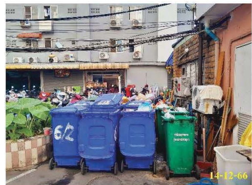
ถังขยะพื้นที่ส่วนกลาง