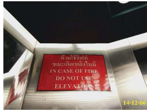
ป้าย “ห้ามใช้ลิฟท์ขณะเกิดเหตุเพลิงไหม้”