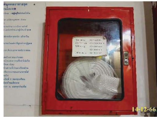
ตู้เก็บสายฉีดน้ำดับเพลิงพร้อมอุปกรณ์