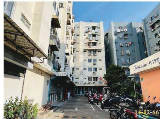
ภาพที่ 1.3.1-1 อาคารโครงการ