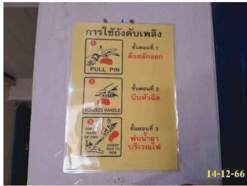
ป้ายแนะนำการใช้อุปกรณ์