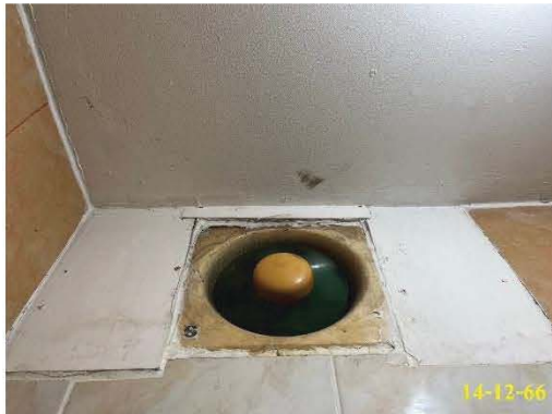
ระบบระบายอากาศวิธีกล

ระบบปรับอากาศภายในอาคารของโครงการทั้งบริเวณ เช่น สำนักงานนิติบุคคลอาคารชุด และบริเวณห้องพักอาศัย จะใช้เครื่องปรับอากาศแบบแยกส่วนทั้งหมด