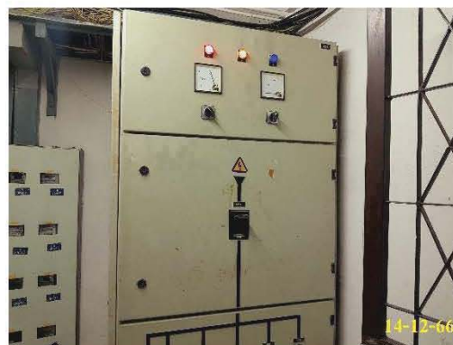
ตู้ควบคุมระบบไฟฟ้าหลัก