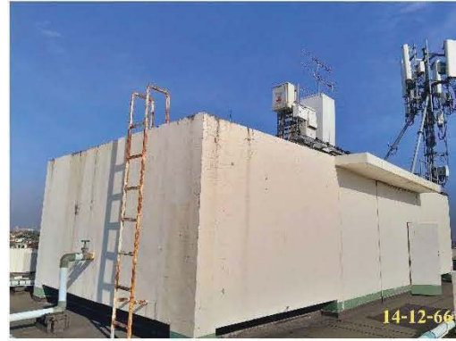
ถังเก็บน้ำชั้นดาดฟ้า