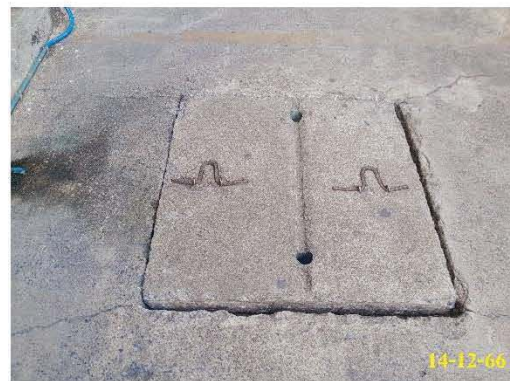
บ่อสุดท้ายก่อนระบายน้ำออก