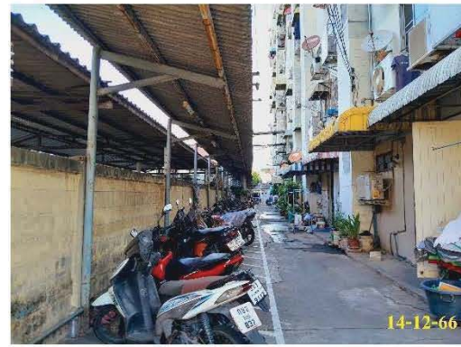
ที่จอดรถ