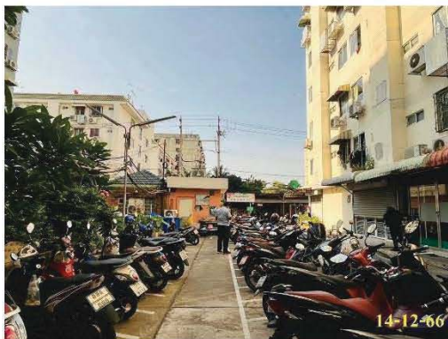
ที่จอดรถ