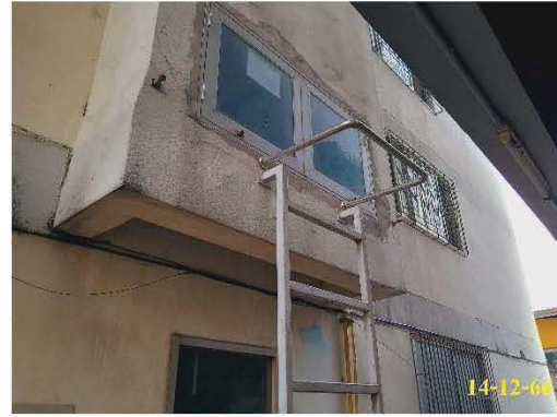
ทางออกบันไดหนีไฟ