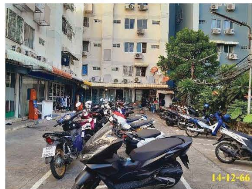
ภาพที่ 1.3.8-1 การจราจร