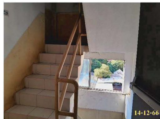
บันไดหนีไฟ ST-2