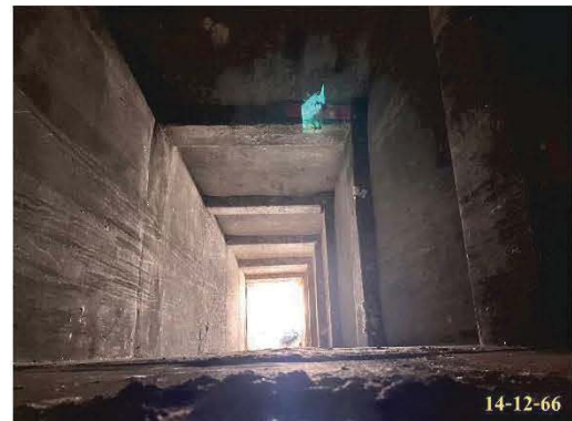
ห้องพักขยะประจำชั้น และปล่องทิ้งขยะ