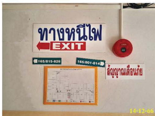
ป้ายบอกทางหนีไฟ