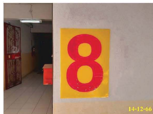
ป้ายบอกชั้น