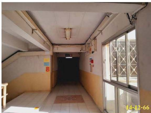
ระบบระบายอากาศวิธีธรรมชาติ