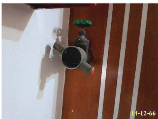
หัวรับน้ำดับเพลิง

โครงการได้จัดให้มีการติดตั้งระบบป้องกันและเตือนอัคคีภัย อย่างเหมาะสมกับสภาพพื้นที่ของโครงการ ระบบป้องกันอัคคีภัยของโครงการเป็นระบบที่ได้จัดเตรียมให้สอดคล้องตามข้อบัญญัติกรุงเทพมหานคร เรื่องควบคุมอาคาร พ.ศ. 2544 กฎกระทรวงฉบับที่ 33 (พ.ศ. 2535) แก้ไขเพิ่มเติมโดยกฎกระทรวงฉบับที่ 50 (พ.ศ. 2540) กฎกระทรวงฉบับที่ 55 (พ.ศ.2543) แก้ไขเพิ่มเติมโดยกฎกระทรวงฉบับที่ 61 (พ.ศ. 2550) และกฎกระทรวงฉบับที่ 39 (พ.ศ. 2543) ออกตามความในพระราชบัญญัติควบคุมอาคาร พ.ศ.2522 โดยประกอบด้วย ระบบป้องกันอัคคีภัย ระบบเตือนอัคคีภัย ทางหนีไฟ แผนการอพยพหนีไฟ และจุดรวมคนเบื้องต้น ที่มีการติดตั้งอย่างเหมาะสมกับสภาพปัจจุบัน