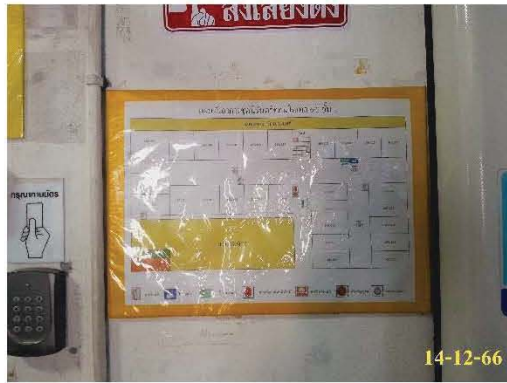
แผนผังเส้นทางหนีไฟ