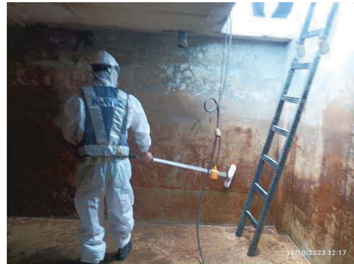
ล้างถังเก็บน้ำใช้