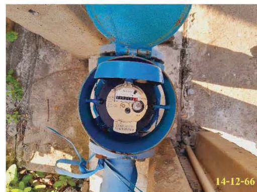
มิเตอร์รับน้ำประปา