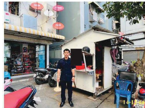
เจ้าหน้าที่รักษาความปลอดภัย