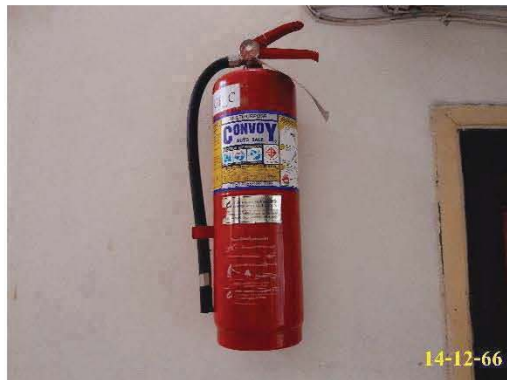
ถังดับเพลิงเคมีชนิด ABC