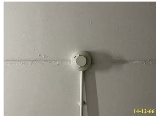
เครื่องตรวจจับควัน