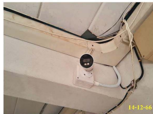
กล้องวงจรปิดภายในอาคาร