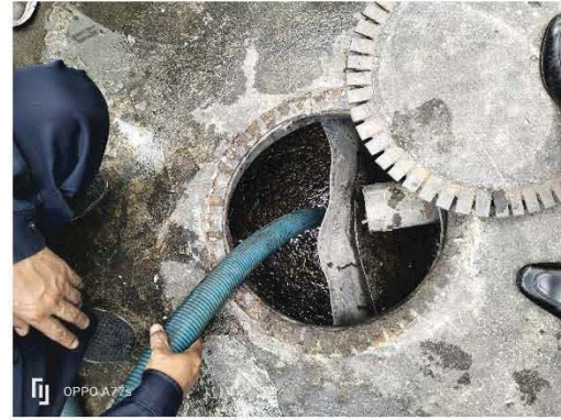
การสูบน้ำออกจากระบบบำบัดน้ำเสีย