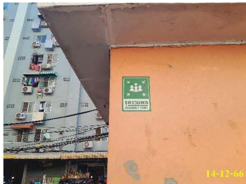
จุดรวมพล