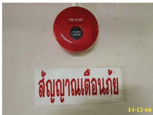
กริ่งสัญญาณเตือนภัย