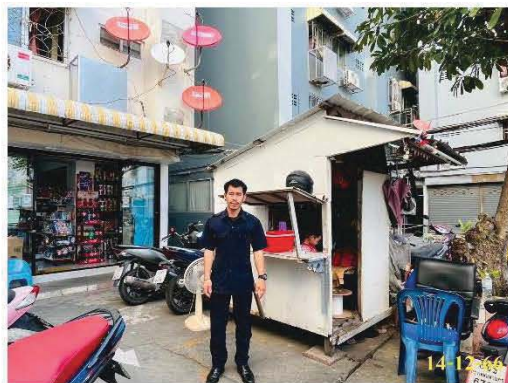
เจ้าหน้าที่รักษาความปลอดภัย

โครงการจัดให้มีระบบการรักษาความปลอดภัยโดยจัดให้มีเจ้าหน้าที่รักษาความปลอดภัยบริเวณทางเข้า-ออกโครงการ ตลอด 24 ชั่วโมง พร้อมทั้งได้มีการติดตั้งกล้องวงจรปิด (CCTV) ทั้งภายใน และภายนอกโครงการ ทั้งนี้ยังควบคุมการเข้าออกอาคารชุดพักอาศัยด้วยด้วยระบบคีย์การ์ด