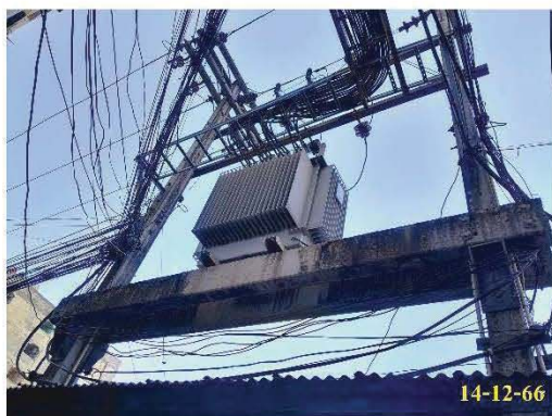
หม้อแปลงไฟฟ้า

โครงการจะรับกระแสไฟฟ้าจากการไฟฟ้านครหลวง ผ่านหม้อแปลงไฟฟ้า ชนิด Oil Immersed Type จำนวน 1 ชุด ขนาด 24 KV เพื่อจ่ายไปยัง Load ต่างๆ ของห้องพักและระบบไฟฟ้าส่วนกลางของโครงการทั้งหมดในสภาวะปกติ โดยทางโครงการได้จัดให้มีการตรวจสอบ และบำรุงรักษาระบบไฟฟ้าเป็นประจำทุกปี