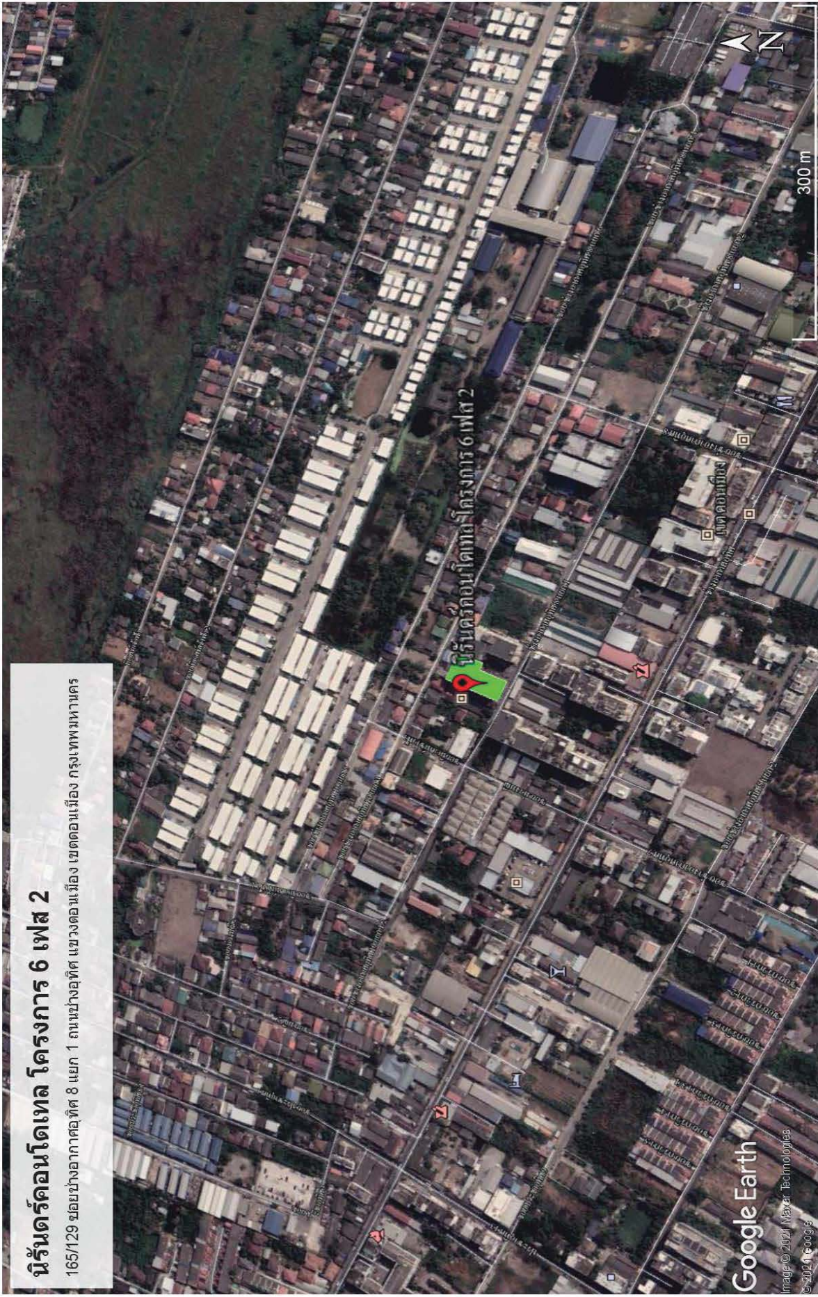
นิรันดร์คอนโดเทล โครงการ 6 เฟส 2 165/129 ขอยางอากาศทิต 8 แยก 1 ถนนพหลโยธิต แขวงดอนเมือง เขตดอนเมือง กรุงเทพมหานคร