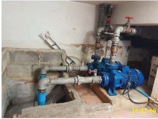
ถังเก็บน้ำใต้ดิน และเครื่องสูบน้ำ