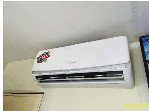
ระบบปรับอากาศ