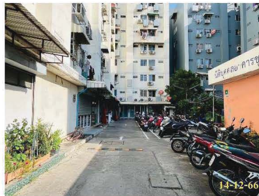
ภาพที่ 1.2-2 สภาพปัจจุบัน