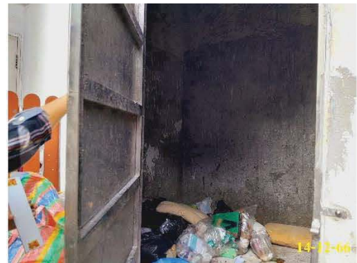
ห้องพักขยะรวม