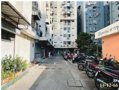
ทางเข้า-ออกโครงการ

ทางเข้า-ออกโครงการ มีจำนวน 1 จุด ใช้เป็นทางเข้า-ออกโครงการ เชื่อมกับซอยข้างอากาศอุทิศ 8 แยก 1 ด้านหน้าโครงการสำหรับถนนภายในโครงการและทางวิ่งภายในอาคารจอดรถ ให้มีความกว้างอย่างเหมาะสม พร้อมจัดให้มีเจ้าหน้าที่รักษาความปลอดภัยคอยดูแลความสะดวกด้านการจราจรบริเวณทางเข้า-ออกโครงการตลอด 24 ชั่วโมง