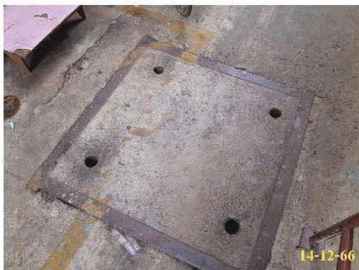
ท่อระบายน้ำรอบโครงการ

ปัจจุบันระบบการระบายน้ำและป้องกันน้ำท่วมภายในโครงการเป็นระบบระบายน้ำแบบท่อแยก กล่าวคือ น้ำทิ้งจะระบายลงสู่ท่อระบายน้ำสาธารณะโดยไม่ไหลเข้าสู่บ่อหน่วงน้ำ และบ่อหน่วงน้ำจะรองรับน้ำฝนเพียงอย่างเดียวเท่านั้น ซึ่งระบบต่าง ๆ ปัจจุบันมีการทำงานอย่างมีประสิทธิภาพ และในการระบายน้ำและป้องกันน้ำท่วมภายในโครงการนั้น จะมีการออกแบบให้มีบ่อหน่วงน้ำ จำนวน 1 บ่อ ซึ่งเพียงพอในการรองรับน้ำที่ต้องหน่วงสำหรับการระบายน้ำในพื้นที่โครงการจะไหลเข้าสู่บ่อหน่วงน้ำ เพื่อระบายสู่ท่อระบายน้ำสาธารณะ