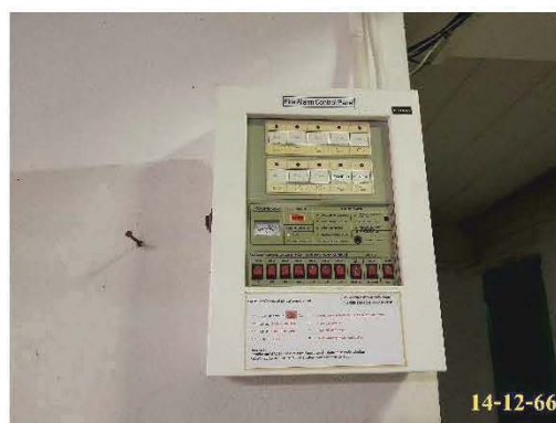
แผงควบคุม