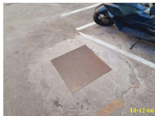
พื้นที่ระบบบำบัดน้ำเสียแบบบ่อเกราะ-กรองไร้อากาศ