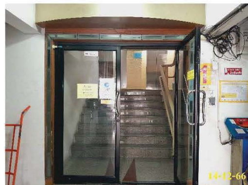
ระบบคีย์การ์ดเข้า-ออกอาคาร