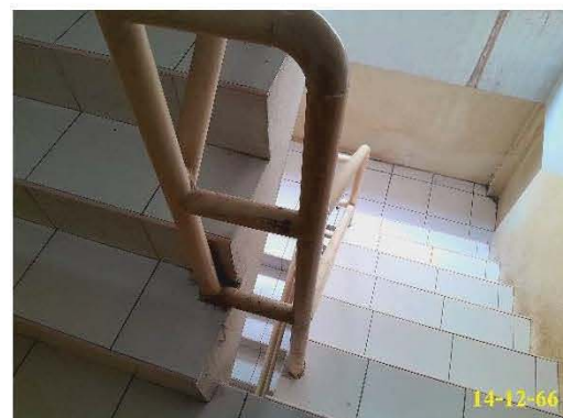
บันไดหนีไฟ ST-1