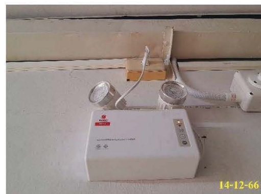
ไฟฉุกเฉิน